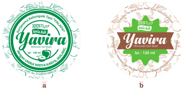
Gambar 2. Desain label awal