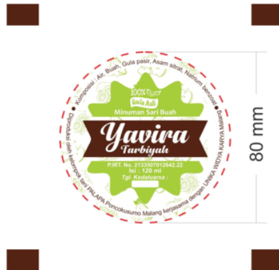
Gambar 7. Ukuran Plastik Kemasan