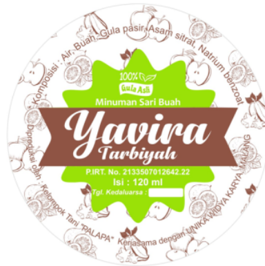
Gambar 5. Hasil Desain dengan Warna yang Lebih Terang