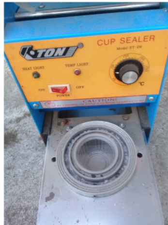
Gambar 6. Cup Sealer yang Telah Dimiliki Kelompok Tani