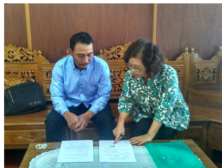
Gambar 10. Penandatanganan Berita Acara telah Melakukan Pengabdian Masyarakat

Pelaksanaan pengabdian berikutnya adalah penyuluhan dengan metode ceramah dan diskusi terkait kemasan pangan/pembungkusan