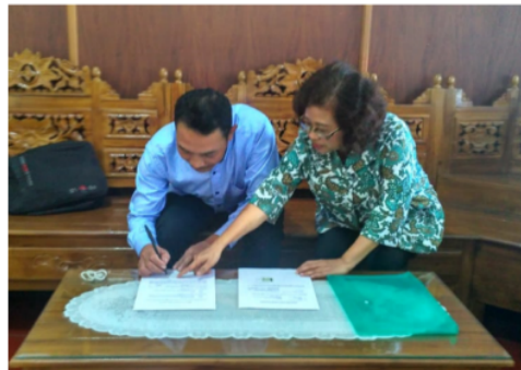
Gambar 9. Penandatanganan Berita Acara Penyerahan Barang