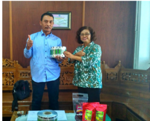
Gambar 8. Penyerahan plastik rol dengan label yang baru