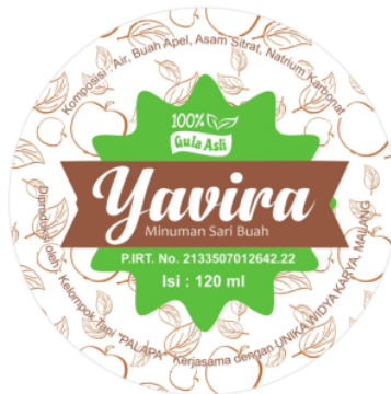
Gambar 3. Hasil desain dengan PIRT