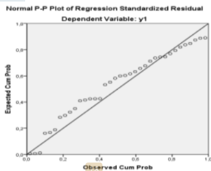
Gambar 2. Grafik Normal Probability Plot

Uji normalitas dilakukan untuk menguji apakah data yang akan dianalisis berbentuk sebaran normal atau tidak. Uji dilakukan dengan menggunakan grafik Normal Probability Plot . Model regresi yang baik adalah model dengan nilai error yang berdistribusi normal atau mendekati normal atau dengan kata lain data dikatakan berdistribusi normal, jika data menyebar di sekitar garis diagonal atau grafik histogramnya.. Hasil uji dapat dilihat pada Gambar 2.