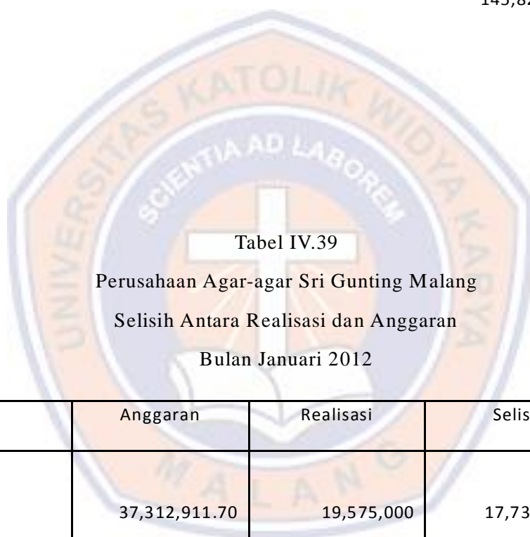
Tabel IV.39 Perusahaan Agar-agar Sri Gunting Malang Selisih Antara Realisasi dan Anggaran Bulan Januari 2012