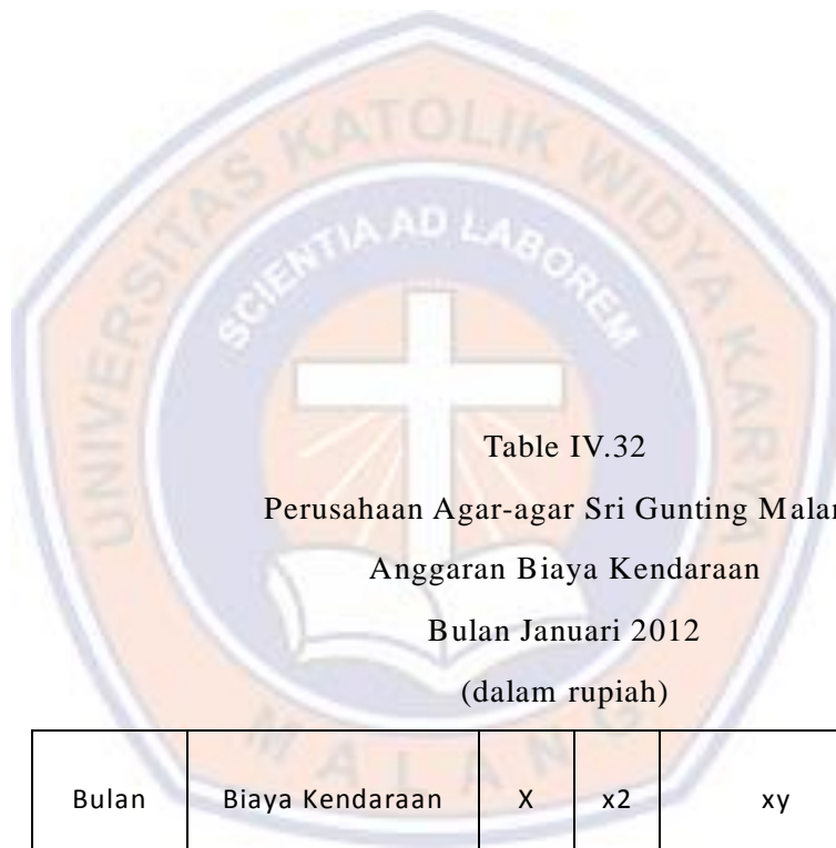
Table IV.32 Perusahaan Agar-agar Sri Gunting Malang Anggaran Biaya Kendaraan Bulan Januari 2012 (dalam rupiah)