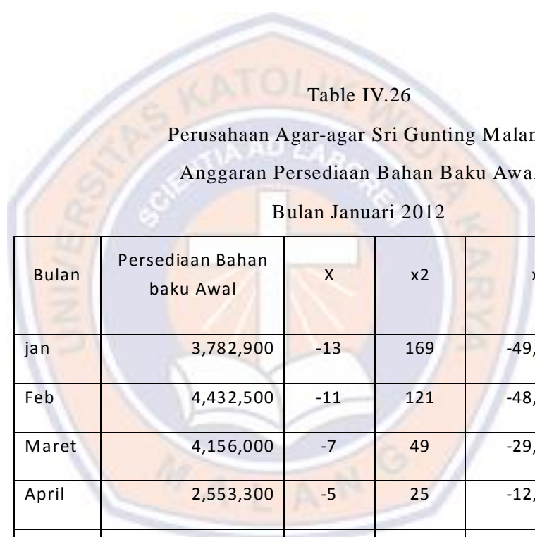
Table IV.26 Perusahaan Agar-agar Sri Gunting Malang Anggaran Persediaan Bahan Baku Awal Bulan Januari 2012