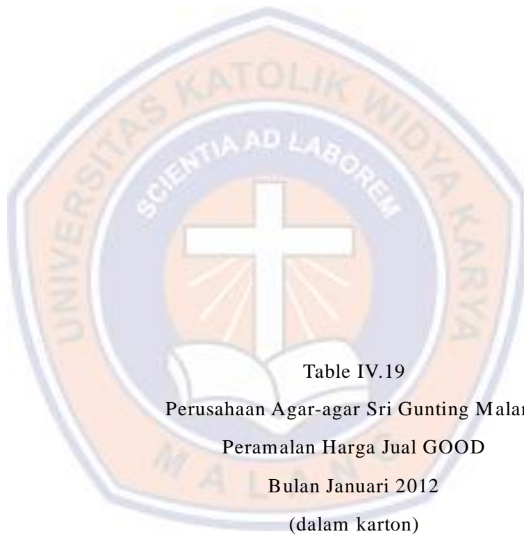
Table IV.19 Perusahaan Agar-agar Sri Gunting Malang Peramalan Harga Jual GOOD Bulan Januari 2012 (dalam karton)

Sebelum menyusun anggaran produksi, terlebih dahulu melakukan peramalan harga jual produk pada bulan Januari 2012 dengan menggunakan metode Least Square , yaitu