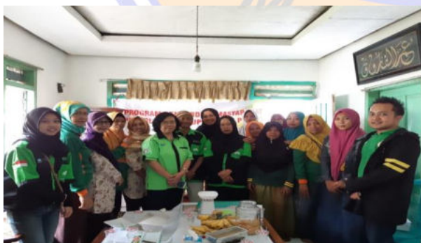
Gambar 1. Foto bersama ibu ibu kelompok tani “Anggrek”