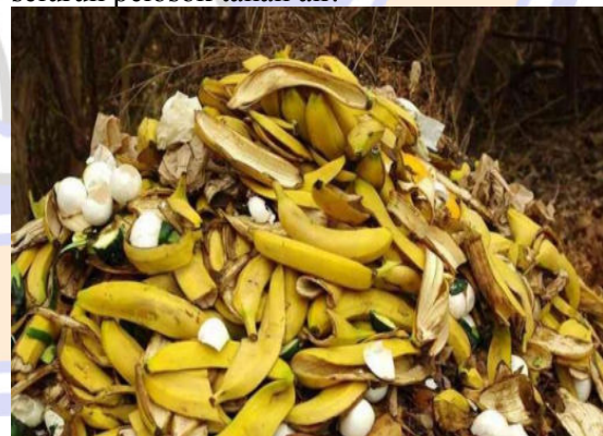
Gambar 1. Limbah Kulit Pisang

perkembangan, serta mudah ditemukan di seluruh pelosok tanah air.