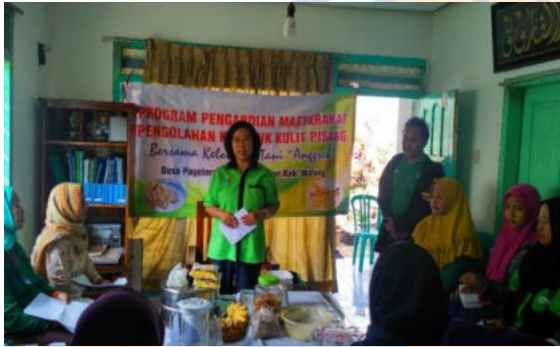
Gambar 2. Penyuluhan pembuatan kerupuk kulit pisang