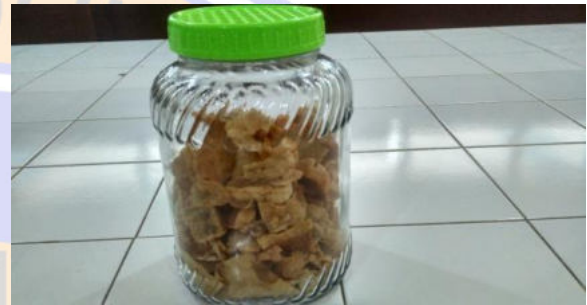
Gambar 6. Kerupuk kulit pisang yang siap dikonsumsi