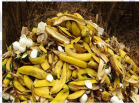
Gambar 1. Limbah Kulit Pisang

perkembangan, serta mudah ditemukan di seluruh pelosok tanah air.