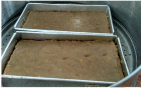
Gambar 5. Adonan Kerupuk kulit pisang yang dikukus