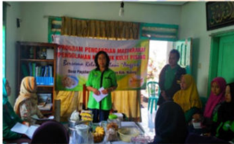
Gambar 2. Penyuluhan pembuatan kerupuk kulit pisang