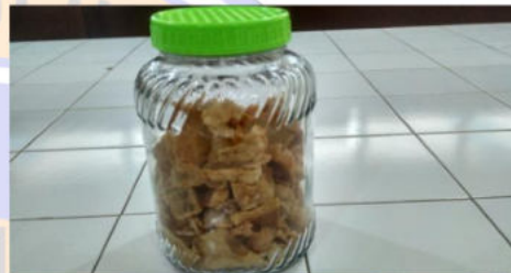
Gambar 6. Kerupuk kulit pisang yang siap dikonsumsi