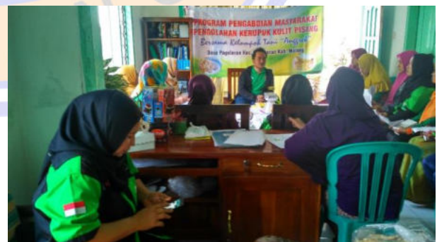
Gambar 3. Penyuluhan pemasaran produk online