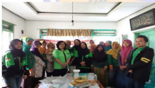
Gambar 1. Foto bersama ibu ibu kelompok tani "Angrek"