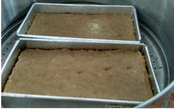
Gambar 5. Adonan Kerupuk kulit pisang yang dikukus