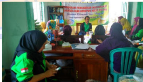
Gambar 3. Penyuluhan pemasaran produk online