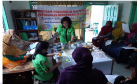
Gambar 4. Demo pembuatan kerupuk kulit pisang