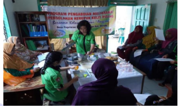
Gambar 4. Demo pembuatan kerupuk kulit pisang