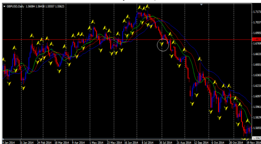
Gambar 7. Analisis Teknikal Computerized Januari 2014 – November 2014

Setelah bulan Oktober 2013, kondisi pasar kembali dalam keadaan sideways yang ditunjukkan dengan garis alligator yang menyempit. Kemudian kembali muncul sinyal untuk membuka posisi buy pada akhir bulan November 2013 di harga 1.64030. Hal ini dikarenakan terbukanya mulut alligator yang terkonfirmasi dengan munculnya buy fractals di atas garis gigi alligator serta terbentuknya candle di atas area mulut alligator.