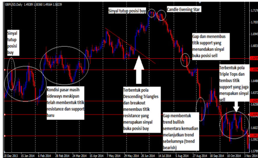
Gambar 4. Analisis Teknikal Classic Periode Januari 2014 – November 2014