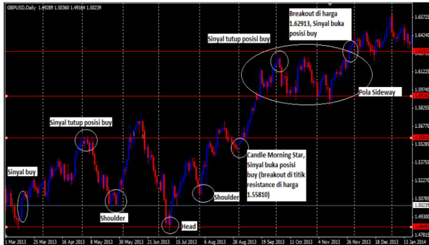
Gambar 3. Analisis Teknikal Classic Periode Maret 2013 – Januari 2014