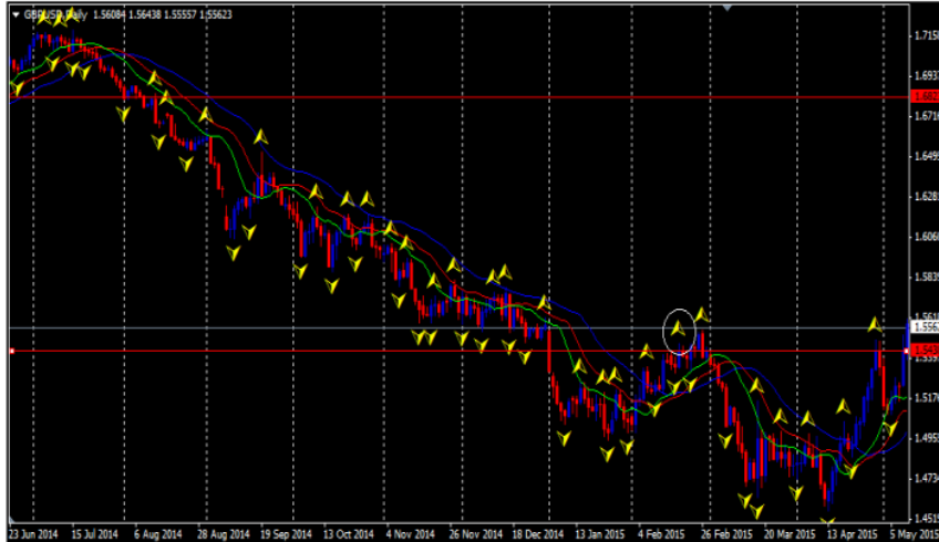
Gambar 8. Analisis Teknikal Computerized November 2014 – April 2015

tersebut merupakan sinyal kuat bagi para trader jangka panjang untuk menutup posisi buy sekaligus membuka posisi sell di harga 1.68233.