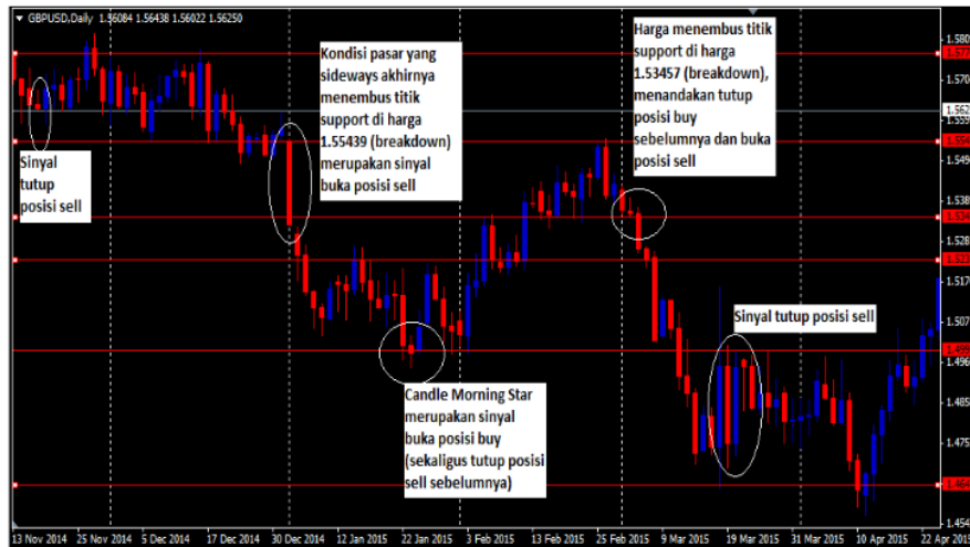
Gambar 5. Analisis Teknikal Classic Periode November 2014 – April 2015