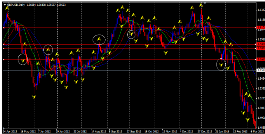
Gambar 6. Analisis Teknikal Computerized Periode April 2012 – Maret 2013