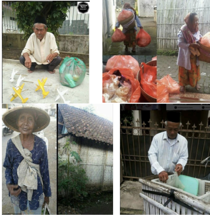
Gambar 1. Para kaum manula produktif di Kota Malang