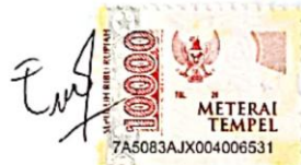
Elisabet Lusitania Sea Deo