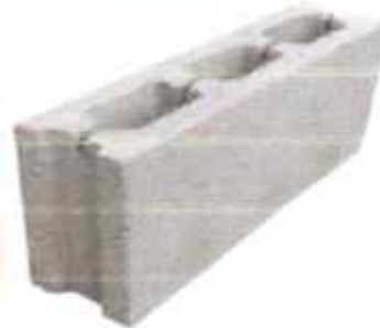
Gambar 2 Batako Semen

Berdasarkan hal tersebut, dimulailah perbaikan kualitas batako tetapi tetap dengan upaya untuk mengontrol biaya produksi, maka digunakanlah semen dan pasir sebagai bahan baku utama batako semen sehingga secara umum batako semen lebih baik dibanding batako tras tetapi dengan harga yang relatif lebih mahal.