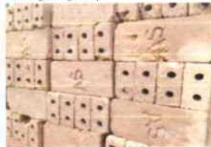
Gambar 1 Batako Tras (Putih)

Kekurangan batako tras mungkin disebabkan karena kurangnya daya rekat sebagaimana yang diberikan oleh semen. Tras adalah tanah yang terbentuk dari batuan yang lapuk dan umumnya ditemukan di sekitar gunung berapi.